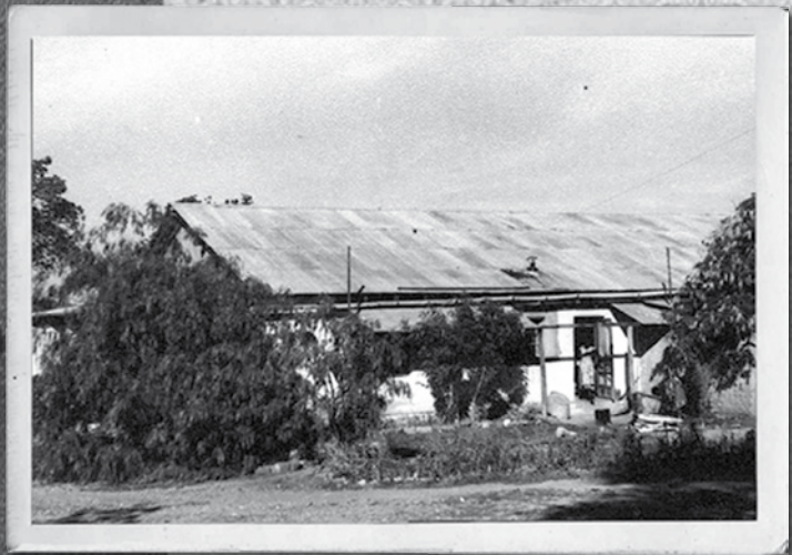
Mi primera casa en Mvumi