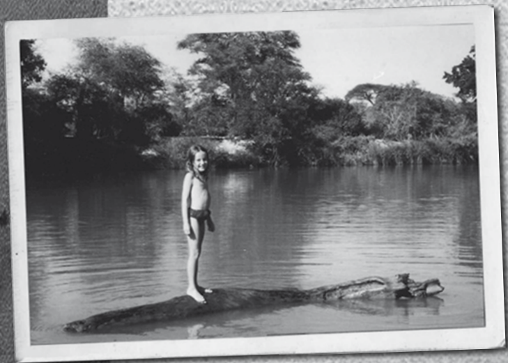
Mi "canoa-tronco" en el Gran Río Ruaha