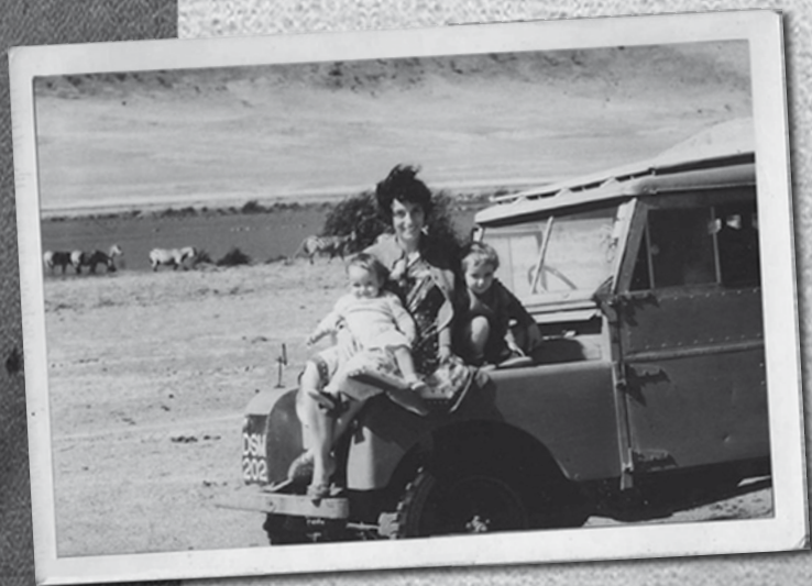
Mi madre con mi hermana y conmigo en el cráter de Ngorogoro