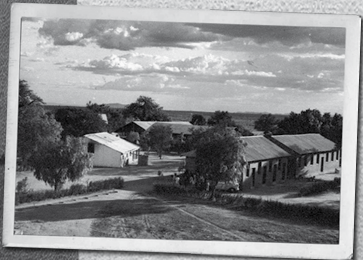
El lugar donde nació - el Hospital Mvumi Bush, Tanganyika