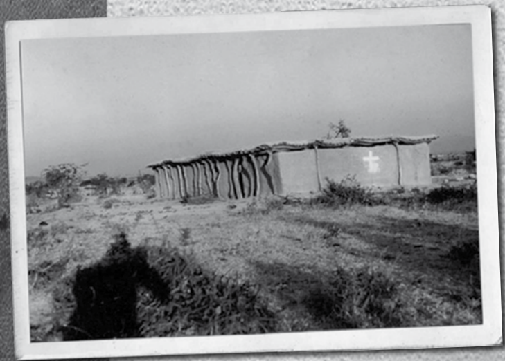
Una iglesia rural cerca de Mvumi