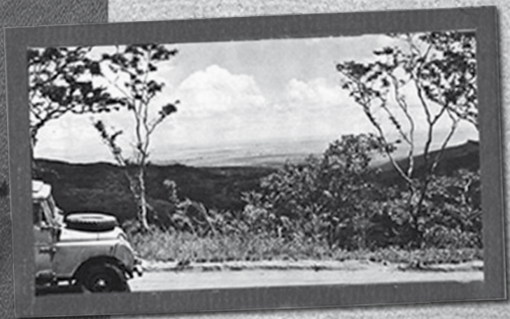
Los valles de Tanganyka desde Pienaar Road