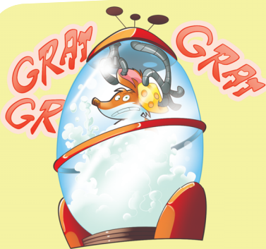
FASE 2: ENJABONAR