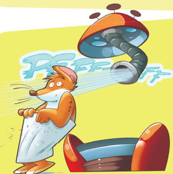
FASE 3: SECAR