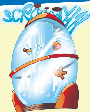
FASE 1: MOJAR