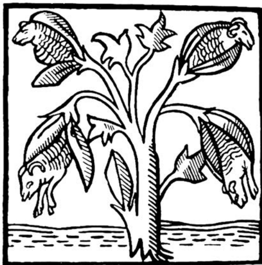
El cordero vegetal: así imaginan los europeos la planta del algodón.

árabe, a través de la voz qutun . Tanto la palabra francesa coton , como la inglesa cotton , la española algodón , la portuguesa algodão , la holandesa katoen y la italiana cotone proceden de esa misma raíz árabe. (El término alemán Baumwolle y el checo bavlna —que podrían traducirse grosso modo como «árbol de lana»— son las excepciones que confirman la regla.)