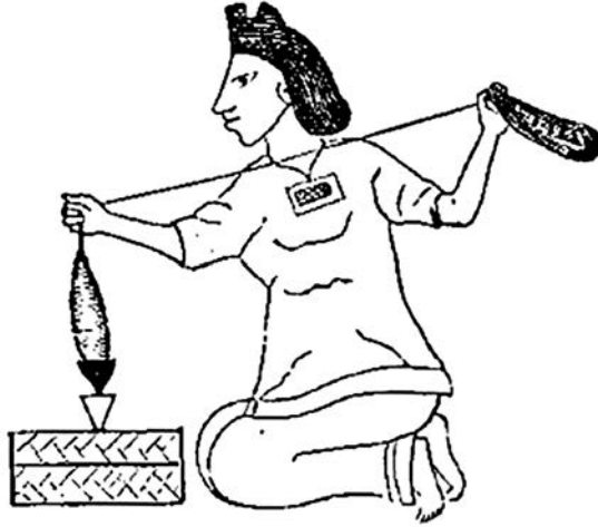
Mujer azteca hilando algodón.

Hace quinientos años, en una docena de pueblecitos situados a lo largo de la costa del Pacífico de lo que actualmente conocemos con el nombre de México, la gente dedicaba la jornada a cultivar maíz, alubias, calabazas y pimientos. En esta zona, entre el río Santiago al norte y el Balsas al sur, estos pueblos se dedicaban a pescar, a buscar ostras y almejas, y a hacerse con la miel y la cera de las abejas silvestres. Además de la práctica de una agricultura de subsistencia y de los modestos productos artesanales que elaboraban a mano —su más reconocida creación eran unas pequeñas vasijas de cerámica pintada que decoraban con motivos geométricos—, estos hombres y mujeres reservaban parte de su tiempo al cultivo de una planta que daba unas pequeñas cápsulas blancas y velludas. Se trataba de un arbusto de frutos incomedibles, pero era también el vegetal más valioso de cuantos centraban sus cuidados. Lo llamaban ichcatl : algodón.