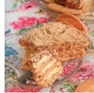
81 TARTA DE GALLETAS PORTUGUESA (BOLO DE BOLACHA)