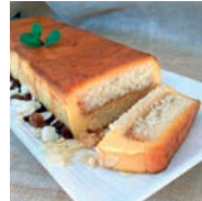
83 TARTA DE FLAN Y BIZCOCHO