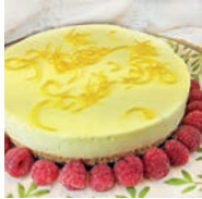
71 TARTA DE LIMÓN