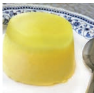
111 CUAJADA DE LECHE Y LIMÓN