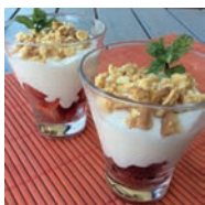
129 VASITOS DE TARTA DE QUESO