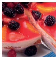
164 GLASEADOS Y COBERTURAS