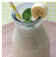
135 SMOOTHIE DE PLÁTANO