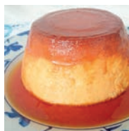
119 FLAN NAPOLITANO