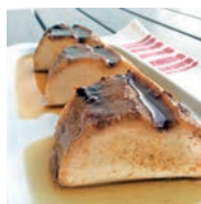
115 FLAN DE GALLETAS