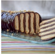
67 TRONCO DE CHOCOLATE