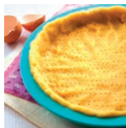
160 BASES DE TARTA