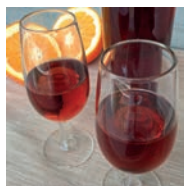
137 VINO DE NARANJA CASERO