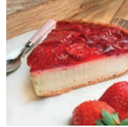
79 TARTA DE YOGUR GRIEGO Y FRESAS