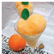
139 SORBETE DE NARANJA