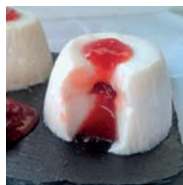
123 PANNA COTTA RELLENA DE MERMELADA