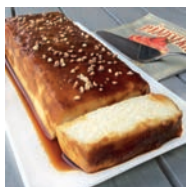
109 FLAN DE CUAJADA, QUESO Y YOGUR