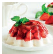
159 PREPARACIÓN DE GELATINA