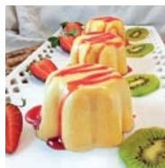
113 FLAN DE MANGO