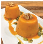
117 FLAN DE CALABAZA Y NUECES SIN HUEVO