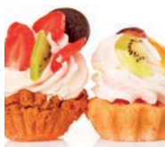
152 NATA MONTADA FIRME Y ESTABLE