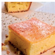
154 SECRETOS PARA UN BIZCOCHO PERFECTO