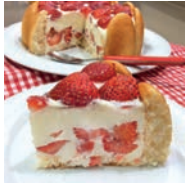
73 CHARLOTA DE FRESAS