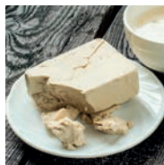
156 TRUCOS Y USOS DE LA LEVADURA