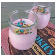
131 PETIT CASERO DE FRUTAS