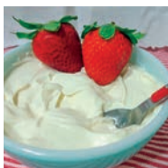
133 QUESO MASCARPONE