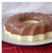
121 CORONA DE CHOCOLATE