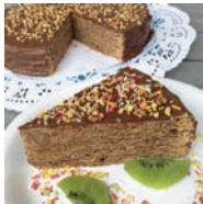
75 TARTA DE OBLEAS Y CHOCOLATE