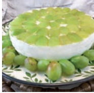
69 TARTA DE QUESO Y UVAS