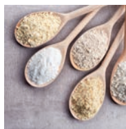
162 LAS HARINAS