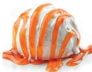
144 CARAMELO LÍQUIDO