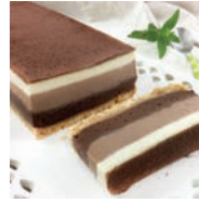
77 TARTA TRES CHOCOLATES