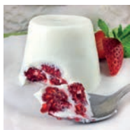
103 FLAN DE YOGUR