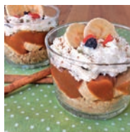
141 VASITOS BANOFFEE