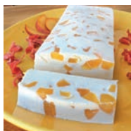
107 FLAN DE QUESO Y FRUTAS