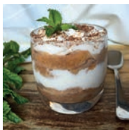
127 VASITOS DE TIRAMISÚ