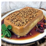
105 FLAN DE QUESO FRÍO SIN HORNO