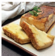
101 CUAJADA DE QUESITOS Y BIZCOCHOS