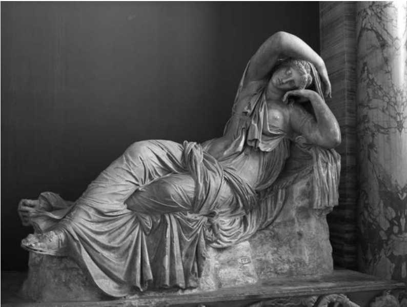
Figura 3. Ariadna dormida . Copia romana del siglo II de un original griego de época helenística. Museos Vaticanos, Inv. 548.

su imagen de Baco y Ariadna que mil estudiosos de religión y filología griega: su salto no solo anticipa el Barroco en las artes, sino que evoca toda la potencia de la salvación dionisiaca en Naxos. 2