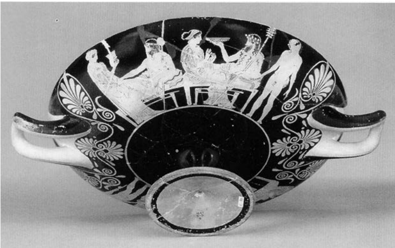
Figura 5. Komos atendiendo a Dioniso y Ariadna, entre otras figuras, en una copa de figuras negras atribuida al Pintor de Codro, c. 440 a.C. British Museum, Londres, E 82.

nidad. Dioniso era conocido ya por Homero, quien le considera un dios que procura el «goce de los mortales», en referencia al don del vino. 6 Las escasas menciones de Dioniso en comparación con otros dioses han sido bien explicadas por Privitera (1970) mediante la probable existencia de un corpus de poesía dionisiaca de ámbito propio. También esta faceta de consuelo del vino a los seres humanos es citada por Hesíodo en un sentido importante para su épica didáctica de los ciclos agrícolas del arcaísmo griego. 7 El don de Dioniso es conocido y ponderado muy positivamente por la lírica arcaica de un Arquíloco, un Alceo o un Anacreonte, y el canto al éxtasis del vino se hará un hueco muy relevante en las composiciones poéticas. En la presencia de figuras divinas en la cerámica arcaica de los siglos VI a V a.C. se ha constatado una abundancia de los personajes de la corte dionisiaca, triunfante en la ebriedad de sátiros y silenos que transportan el vino o sirven en el banquete al dios y a su consorte, atrayendo irresistiblemente la atención del espectador (figura 5).