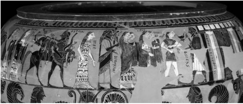
Figura 6. Dinos ático de figuras negras de Sófilo. Detalle: Dioniso en procesión por las bodas de Tetis y Peleo, 570-580 a.C. British Museum, Londres, 1971, 11-1.1.

Tal vez la primera aparición iconográfica individualizada de Dioniso sea en un dinos ático de Sófilo de 570 a.C. (figura 6) que, junto con el famoso y ya mencionado vaso François, quizá fechable una década más tarde, retrata a Dioniso en el cortejo de dioses que se dirige hacia las bodas de Tetis y Peleo para presentar sus regalos. El don de Dioniso, un cántaro con el vino embriagador, lo configura como un personaje único y peculiar en ese banquete nupcial primigenio entre dioses y hombres que engendra, como en un Big Bang de la mitología griega, todos los relatos de los héroes griegos, más allá de las fronteras estrictas del ciclo troyano. Dioniso aparece como un dios acaso más rústico o menos civilizado que los demás que desfilan en ambas piezas de cerámica, que están ciertamente perfilados como grandes señores de la época arcaica. Pero se diría que Dioniso, porque precisamente viene de un mundo en los márgenes y en la frontera de la polis con la agricultura, nos conoce mejor a la vez: esa mirada de frente (figura 4) seguramente no responde a un programa iconográfico amable, sino inquietante. 8 Quizá también así se explicita su peculiar situación entre los mundos humano y divino en la separación de Dioniso con respecto a los otros dioses. Es obvio que Dioniso sitúa a la polis , al colectivo —tanto como al individuo— en otra dimensión y otro estado, en una suerte de éxtasis —entendido etimológicamente— lleno de riesgos y oportunidades a la vez: