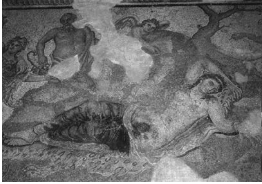
Figura 2. Dioniso descubre a Ariadna en Naxos. Mosaico del siglo IV. Museo Arqueológico de Tesalónica.