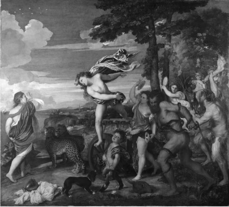
Figura 1. Tiziano, Baco y Ariadna , 1520-1523. National Gallery, Londres.

te (figura 2), observada por un dios del vino que, a modo de voyeur , admiraba su belleza silente y semidesnuda, dormida sobre la hierba en aquella isla cicládica donde la había abandonado el desleal Teseo tras recibir su ayuda en su combate contra el Minotauro.