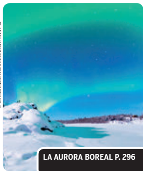
LA AURORA BOREAL P. 296