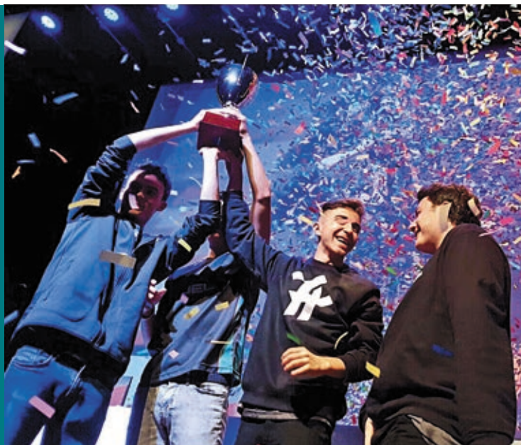
Campeones de la Fun & Serious de Bilbao.

cuando compiten desde casa. Solo podemos ver sus acciones en el juego. Es por ello muy importante que se conozca a la persona que hay detrás del personaje, que se sepa lo que piensa en cada momento, tanto en las victorias como en los fracasos. Y contar su historia desde que comienza a competir hasta que llega a la cima es lo que realmente engancha a millones de espectadores. Por supuesto, las victorias también desempeñan un papel fundamental. Al final los ganadores son los que más atención reciben, eso está claro, pero nunca olvidemos que también es interesante saber cómo han conseguido alcanzar ese punto y conocer las historias que hay tras el