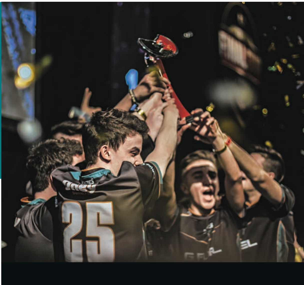
Campeones de España de Call of Duty , Final Cup 11.