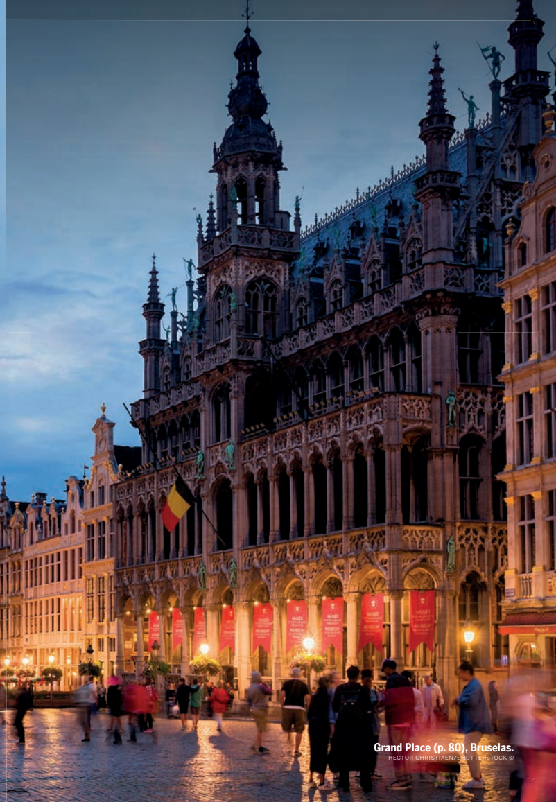
Grand Place (p. 80), Bruselas.