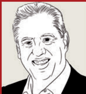
John C. Maxwell