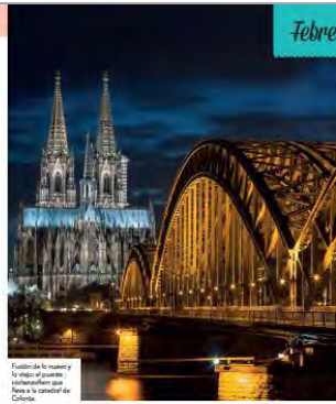
Fiesta de la navena y el Carnaval de Colonia.

La histórica y animada ciudad de Colonia, en Alemania, no solo celebra el Carnaval, sino que le dedica un período específico. La "fiesta templada" comienza oficialmente el 11 de noviembre, pero la fiesta empieza el siguiente febrero, el jueves antes de Cuarema. Luego llegan los "días locos", antes el jueves anterior y el Martes de Ceniza, cuando las calles se llenan de desfiles, danzas, barbita, baile y diversión. Es una lengua más normal en Colonia, famosa por su liberalismo, entusiasmo y generosa cantidad de cervecerías que sirven cerveza local. Hecho, comida abundante y mucho gemütlichkeit (hecho en versión alemana). También hay mucho que ver: la enorme catedral con torres gemelas y las callejuelas de Altstadt (casco antiguo) junto al río, el arte moderno en el Museo Ludwig y la herencia romana en el Romisch-Germanisches. Una forma particularmente conmovedora de desplazarse es siguiendo los Stolpersteine, placas de bronce que recuerdan a las víctimas de los nazis, como de un proyecto del artista local Gunter Demnig son