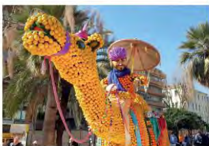
El Carnaval de Niza en febrero.