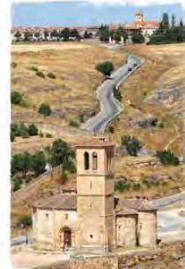
iglesia de la Vera Cruz de Segovia.

DIFICULTAD Físicamente resulta duro, aunque la belleza del paisaje compensa el esfuerzo. Una vez en la llanura castellana, la dificultad es más psicológica. Poco recomendable para principiantes o peregrinos que urgen compañía.