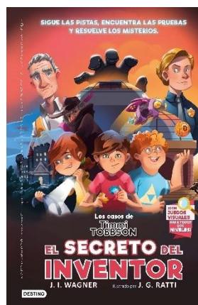
Los casos de Timmi Tobbson 2: El secreto del inventor

¡Desentraña los "misterios de las imágenes" y descubre El enigma del Estrella Fugaz!