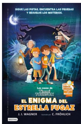
Los casos de Timmi Tobbson 1: El enigma del Estrella Fugaz

¡Sigue las pistas y resuelve los misterios!