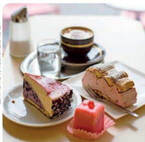
CAFÉ Y TARTA EN VIENA, P. 58