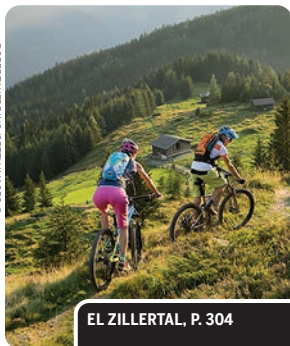
EL ZILLERTAL, P. 304