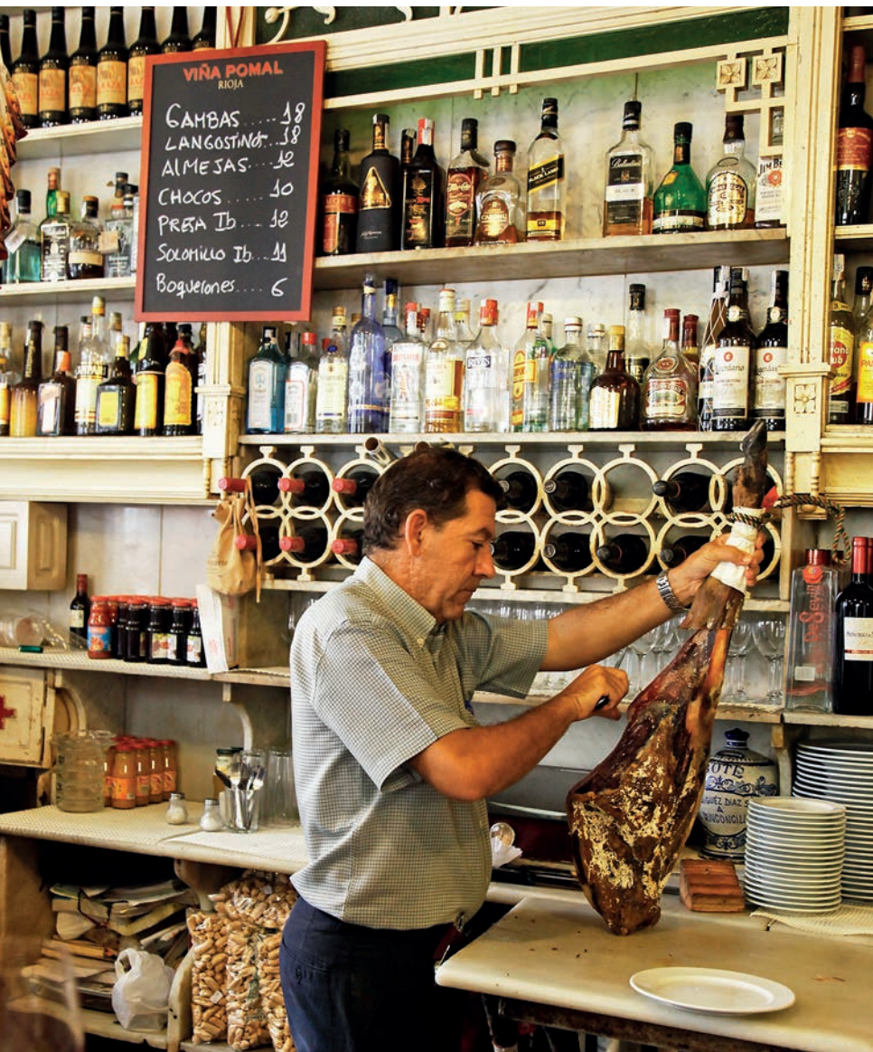
Bar de tapas, Sevilla.