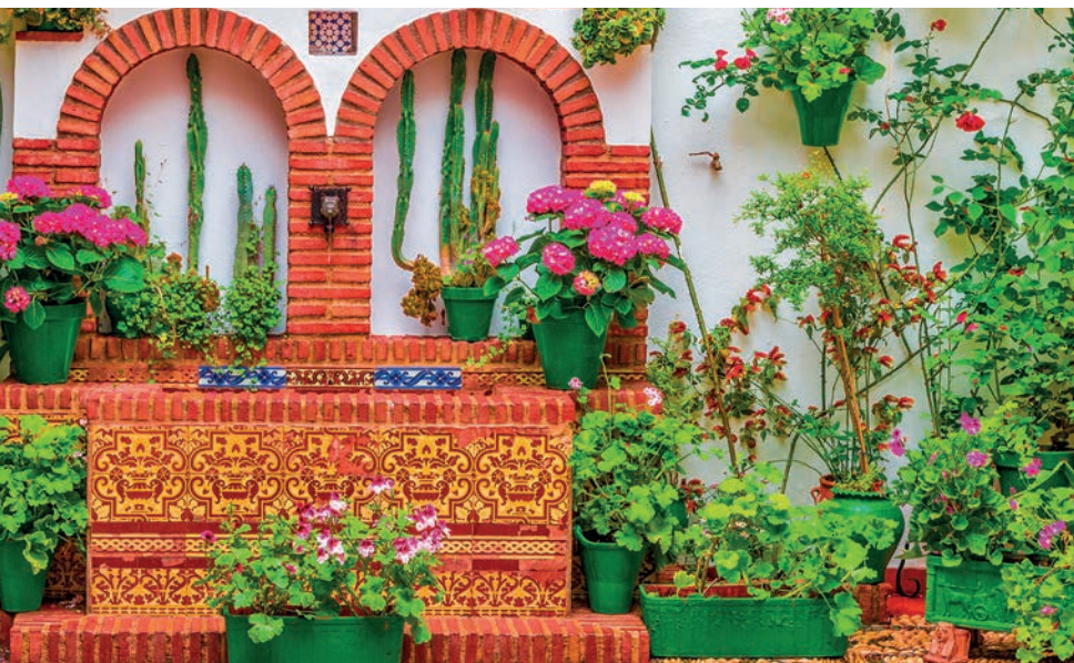
Patio cordobés (p. 166).