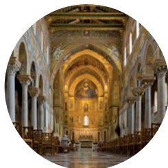
Cattedrale di Monreale (p. 78).