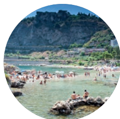
Isola Bella (p. 159), Taormina.