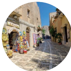
Erice (p. 93).