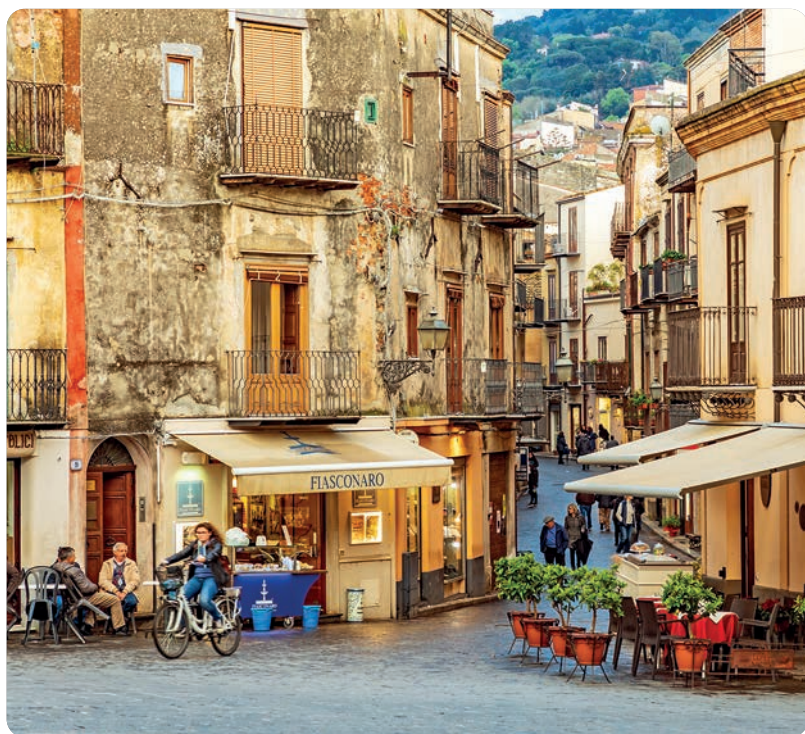
Castelbuono (p. 117).