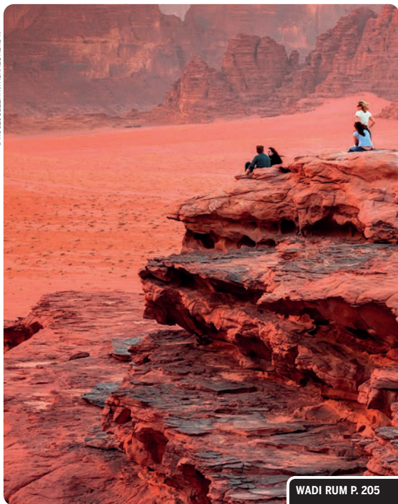
WADI RUM P. 205