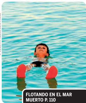
FLOTANDO EN EL MAR MUERTO P. 110