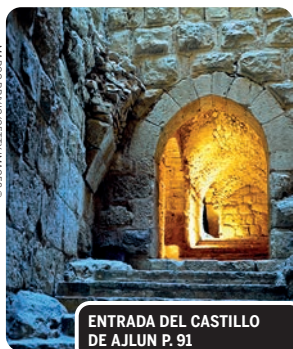
ENTRADA DEL CASTILLO DE AJLUN P. 91