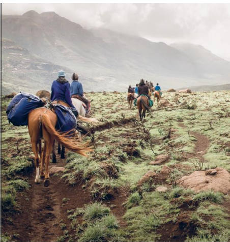
Artista: los caballos en un punto de partida en Lesoto y permiten a los turistas disfrutar un territorio poco poblado por visitantes extranjeros.

Disfruta de una noche en la semana pasada en el Sani Pass y disfruta de una noche en la semana pasada en el Sani Pass.