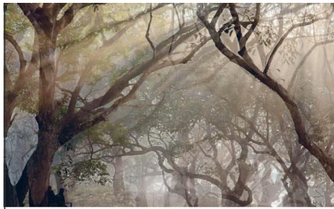
Arriba: los árboles altos en Kaziranga ofrecen muchos rinocerontes. Abajo: el parque es un destino popular para los rinocerontes indios de un solo cuerno.