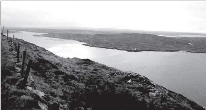
Región de los lagos, Connemara, Irlanda.

Como hemos visto en este pasaje, la realidad celta siempre parece inestable y llena de posibilidades. En ella conviven dos mundos, el visible y el invisible. El mundo visible es el del calendario agrícola, ordenado, que siempre se repite... mientras que el Otromundo es caótico, poblado por los ancestros y el pueblo de los síde (las hadas).