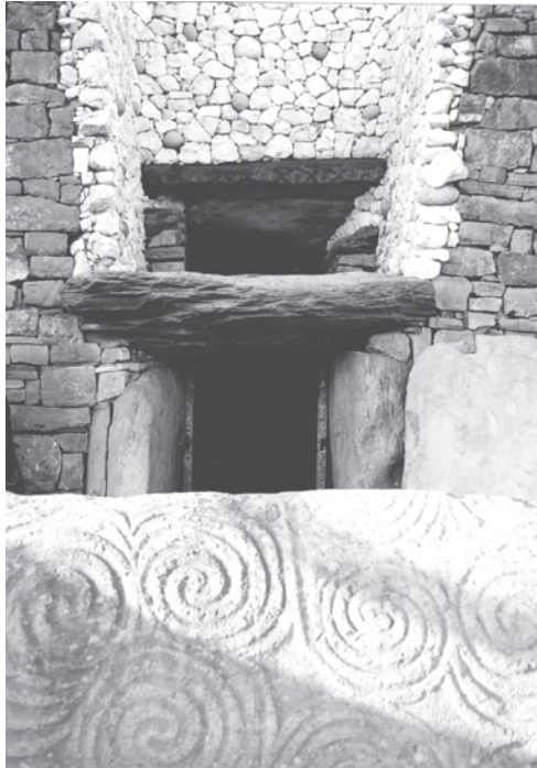
Entrada de la tumba-pasaje de Brú na Bóinne (Newgrange), en Irlanda.