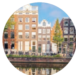
Canal Herengracht (p. 66), Ámsterdam.