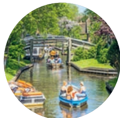
Giethoorn (p. 237), centro de los Países Bajos.