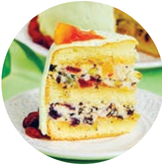
Arriba: 'cassata' siciliana. Abajo: vista de Palermo.