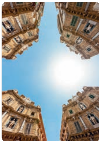
Quattro Canti (p. 44).

Palermo está repleta de estímulos y tesoros artísticos, pero en tres días es factible disfrutar de una muestra lo bastante satisfactoria como para saciar la curiosidad y tan apetitosa como para querer volver.