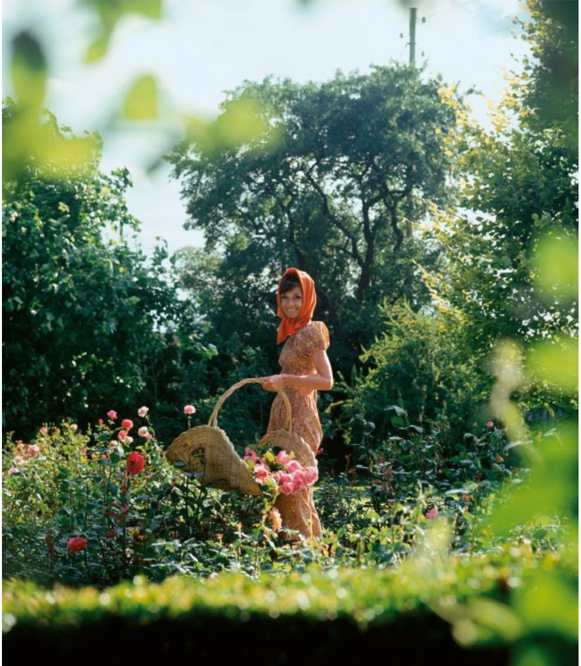
En ningún lugar era más feliz que en su jardín.

i take this opportunity write you a few lines to inquire in health i hope you are in alth i miss you very much i hope the time will when you will be re family again for as a friend of i work i have to d a fine fe made a br d cook of on i read her papers i ho te for you then like i y has