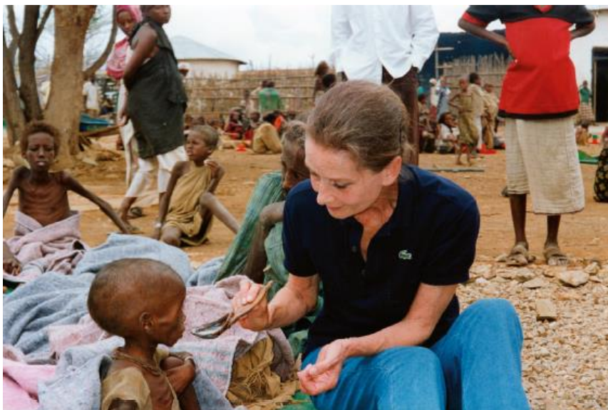
Solo otra cucharadita más. Alimentando a un niño etíope con desnutrición severa

En años posteriores, tras encontrar la felicidad con un holandés que compartía su visión, la preocupación de toda su vida por quienes sufrían las consecuencias de la guerra impulsó a Audrey a abandonar su refugio y utilizar su voz para hacer el bien. Como la embajadora de buena voluntad más conocida en la historia de UNICEF —la misma organización que la salvó a ella y a miles de niños tras la guerra— Audrey se convirtió en la primera gran estrella de Hollywood en recorrer algunos de los países más devastados del mundo para concienciar a la opinión pública sobre la situación de la infancia, incluso a costa de reabrir algunas heridas dolorosas de su pasado. Humanitaria apasionada, también recaudó millones de dólares, entre ellos 60 millones del Congreso de Estados Unidos tras una sola reunión durante un desayuno.